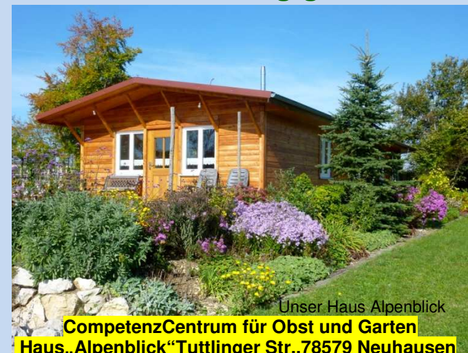
Unser Haus Alpenblick

CompetenzCentrum für Obst und Garten Haus „Alpenblick“ Tuttlinger Str., 78579 Neuhausen